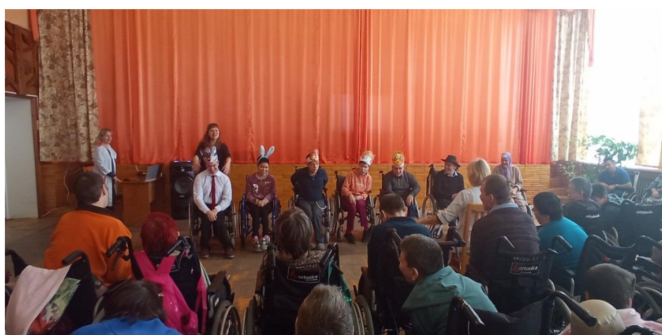
Получатели социальных услуг участвуют в мини-спектаклях, преобразуются в сказочных персонажей и радуют зрителей новыми интересными постановками.