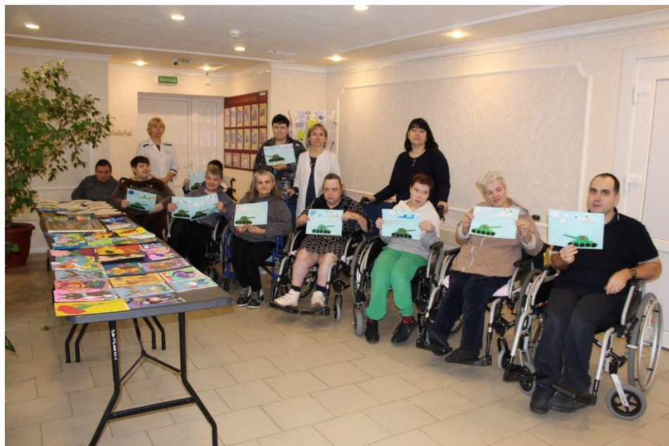
Мастер класс для получателей социальных услуг по изготовлению открытки из бумаги к Дню защитника Отечества.