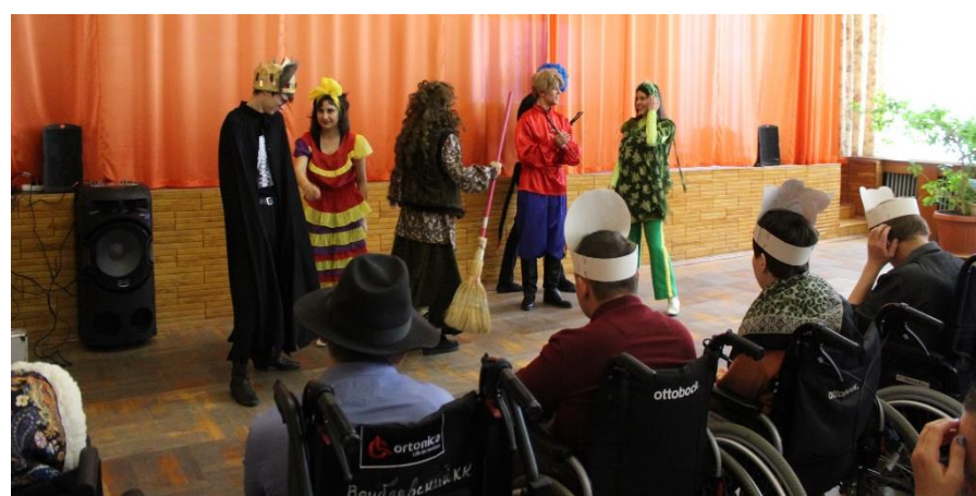
Театральная студия народного творчества «Кредо» Тимашевского районного дома культуры для наших ребят подготовила небольшой спектакль о добре, волшебстве и силе дружбы и взаимоподдержки.