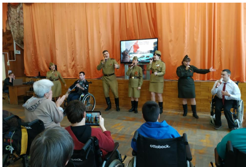
80-я годовщина разгрома немецко-фашистских войск в Сталинградской битве. Познавательный час.