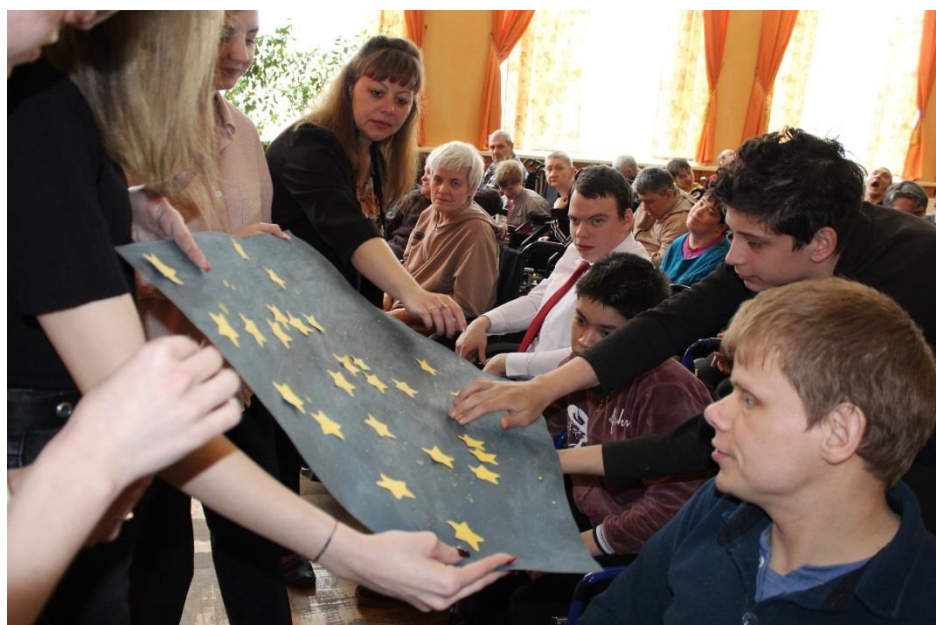
Кроме того, ежедневно проводятся развивающие занятия, проулки на свежем воздухе, чтение книг, написание и прочтение писем, прослушивание музыки.