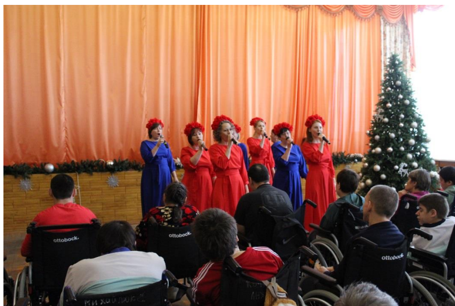
На территории учреждения регулярно проходят концерты и встречи с различными интересными людьми.